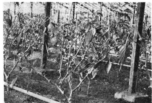
更新せん定した状況

少肥区で施用量を大きく上廻っているのは、試験ハウスの土壤に含まれていた無機態窒素と前作を含めて施用された4トンの堆肥の、高温による急速な分解が影響したためであろう。